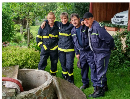
Oprechtičtí hasiči pomáhali vyčerpát zatopenou studnu

Podílejte se na tvorbě věstníku a webu obce i Vy – náměty posílejte na