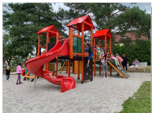
Nové dětské hřiště ve školce